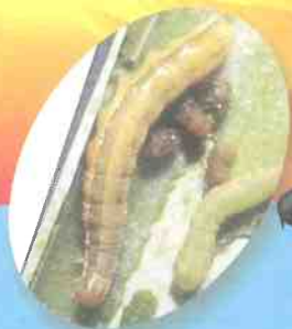
蔥仔管蟲 (甜菜夜蛾)