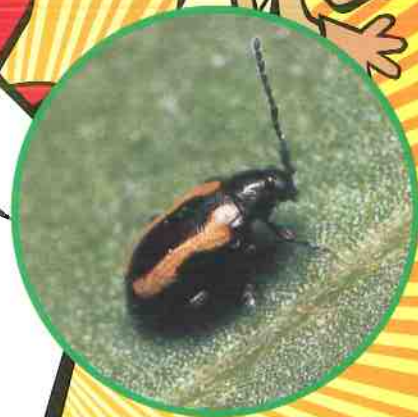
十字花科蔬菜黃條葉蚤